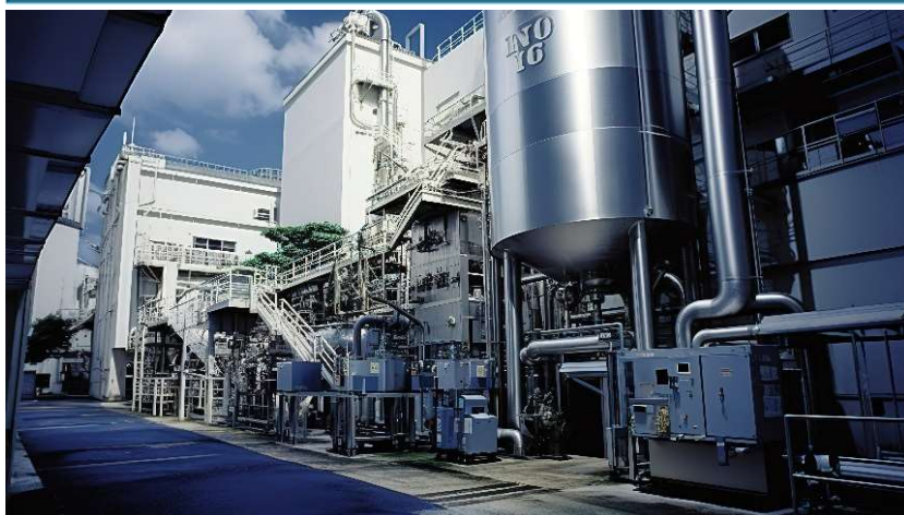
藥品、生技肥料製程