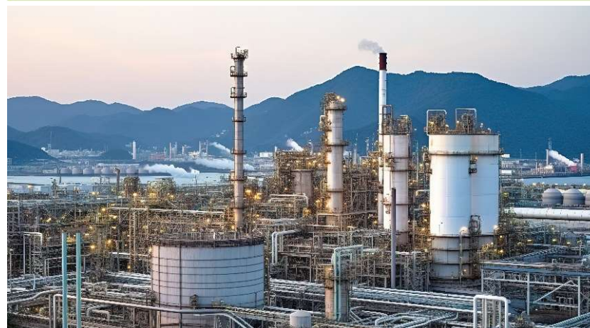
塗裝、電子零件、橡膠製程